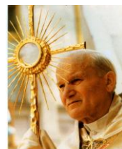
John Paul II

Unis à ton amour, tu nous veux pour toujours ostensoirs du Sauveur, En notre humanité, tu rejoins l'égaré, Tu fais ta demeure en nous Seigneur.